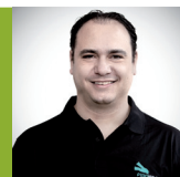
POR JOSEPH SAPIANO

Cuando hablamos de “debilidad”, no estaríamos utilizando la terminología adecuada, ya ▶